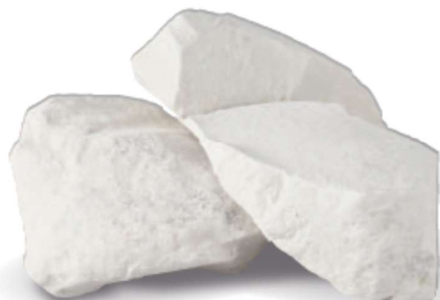
ニチノストーン 原石